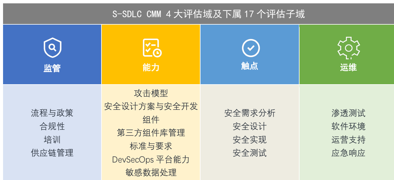
图 1 S-SDLC CMM整体结构图

为指导软件开发组织实施S-SDLC，我们在子域中给出了具体的实践内容以及对应的参考指标，这些措施提炼自大量的实践经验以及业界的先进共识。组织通过实施模型提供的实践内容和参考指标进行改进，能切实提高软件安全开发的能力。S-SDLC CMM整体结构如图1。